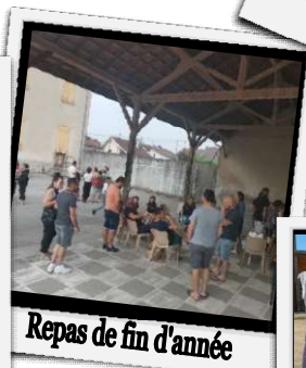
Repas de fin d'année