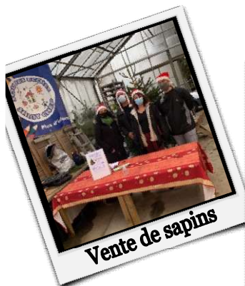
Vente de sapins