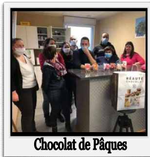
Chocolat de Pâques